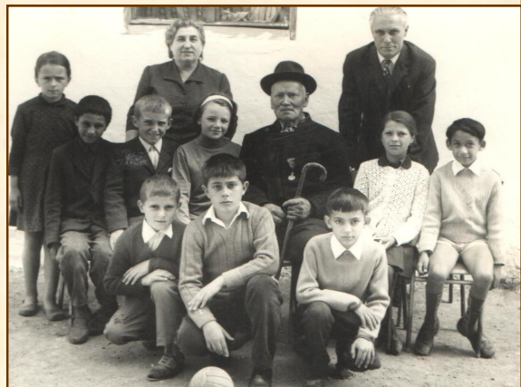
„Солунац” са ђацима