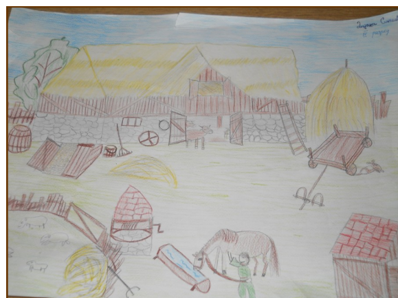
Ликовни радови данашњих ђака школе у град Сталаћу