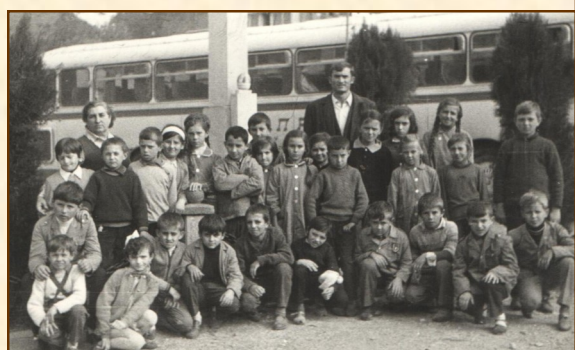
Полазак на екскурзију