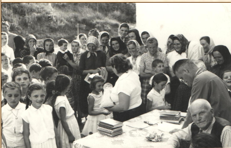
Свечани завршетак школске године