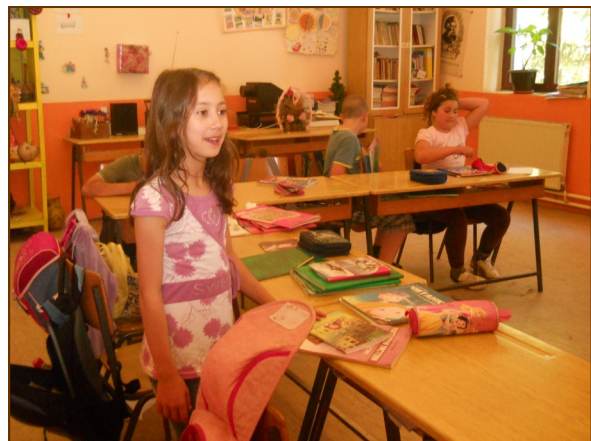
школа у Град Сталаћу данас