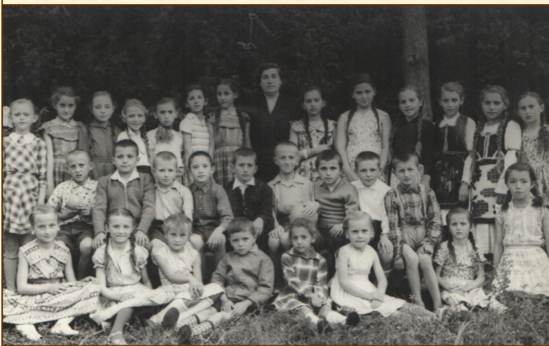
Фотографисање на почетку школске године