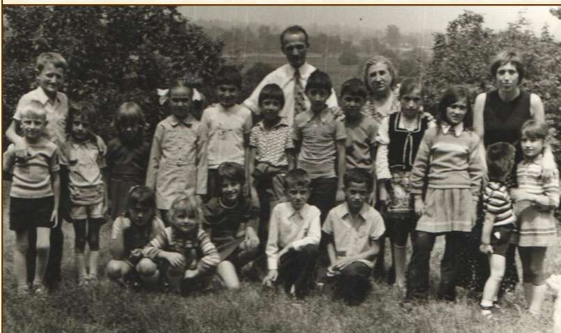
Школа у природи